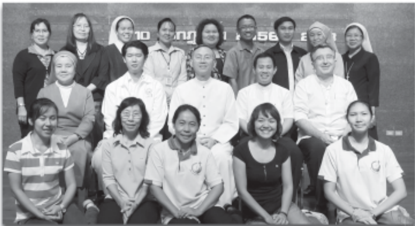
ประชุมคณะกรรมการคาทอลิกเพื่อคริสตศาสนธรรม แผนกคริสตศาสนธรรม ครั้งที่ 2/2013 วันที่ 9-10 กรกฎาคม 2013 ณ บ้านผู้หว่าน สามพราน