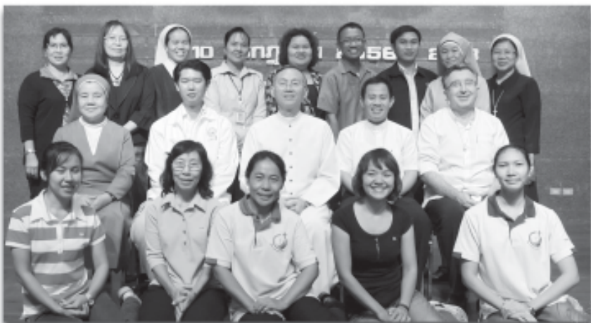
ประชุมคณะกรรมการคาทอลิกเพื่อคริสตศาสนธรรม แผนกคริสตศาสนธรรม ครั้งที่ 2/2013 วันที่ 9-10 กรกฎาคม 2013 ณ บ้านผู้หว่าน สามพราน